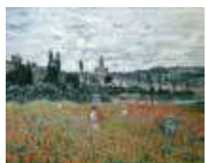
Claude Monet, Champ de coquelicots près de Vétheuil (1879) Fondation BUHRLE Zurich

Claude Monet, peintre impressionniste dans la boucle de Moisson, 1878 – 1881