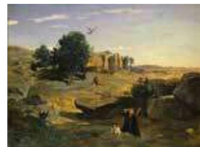
Camille Corot, Agar dans le désert (1833) MoMA New York

Corot, premier peintre à explorer notre région, entraîna ses amis peintres à découvrir la magie de la Seine.