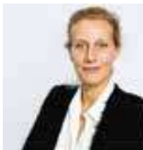
Capucine FAIVRE Maire de La Roche-Guyon