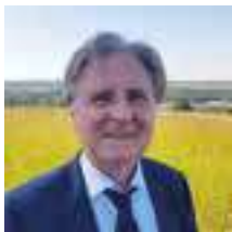
Jean-Marc POMMIER Maire de Bonnières-sur-Seine