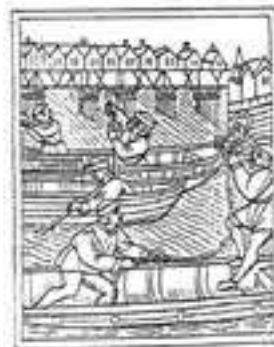
maître de pont

Maîtres de pont et de pertuis pour faciliter la navigation sur la Seine autrefois. 17h-18h15.